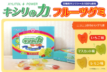
キシリのカ フルーツグミ